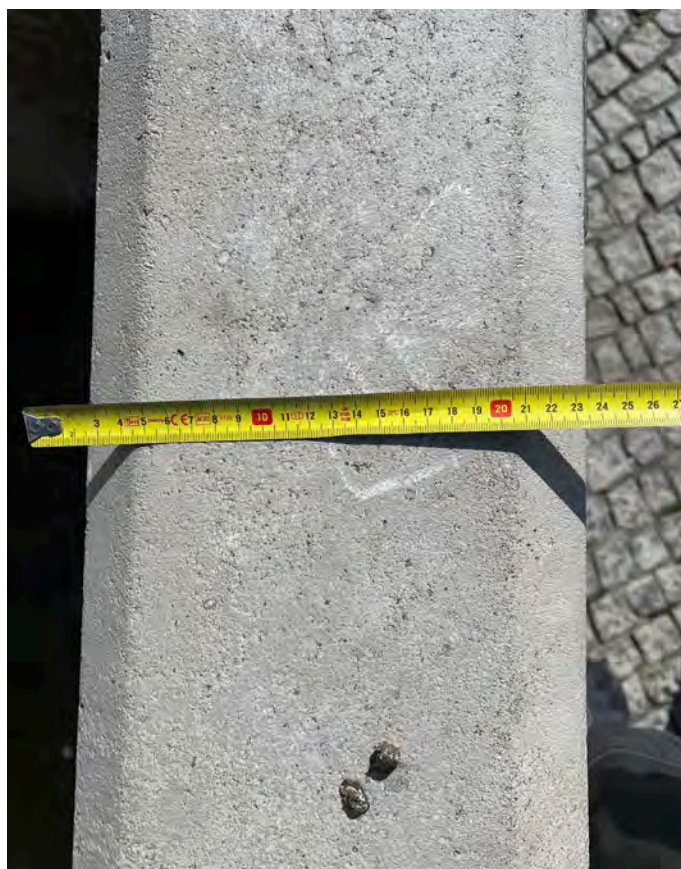
Obr. č. 11-16: Stav památky 3/2024 - rozměrové snímky.