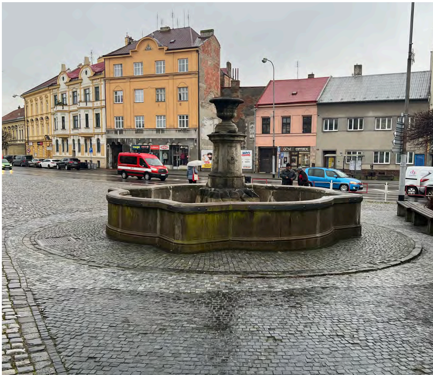
Obr. č. 1: Stav památky 1/2024 - celkový pohled.