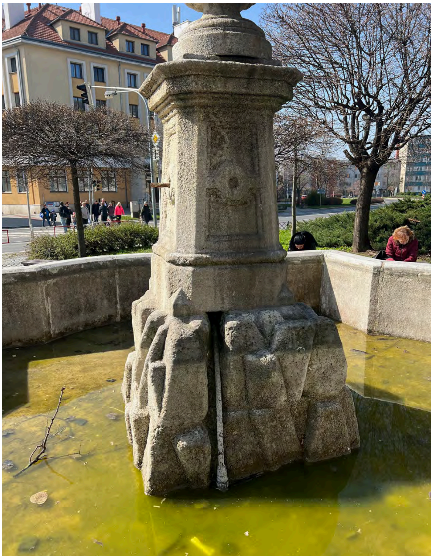
Obr. č. 10: Stav památky 3/2024 - středový pylon pohled do nádrže kašny.