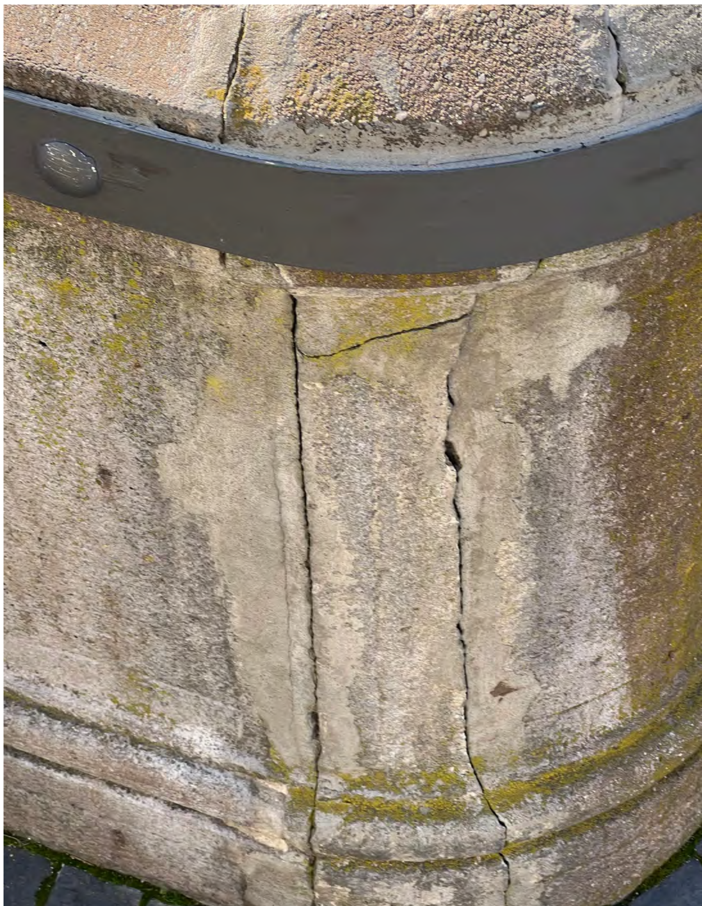
Obr. č. 12: Stav památky 3/2024 - detail prasklin tělesa kašny.