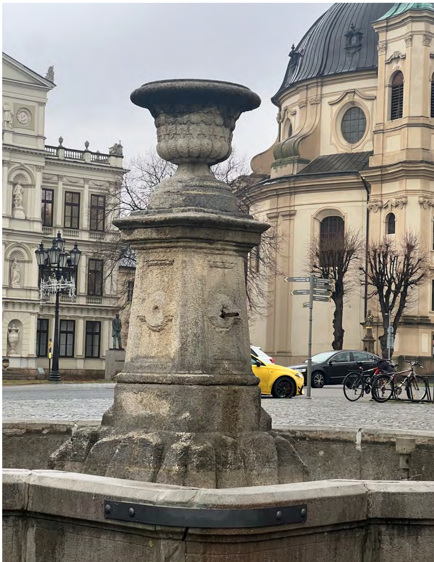
Obr. č. 5: Stav památky 1/2024 - středový pylon s vázou.