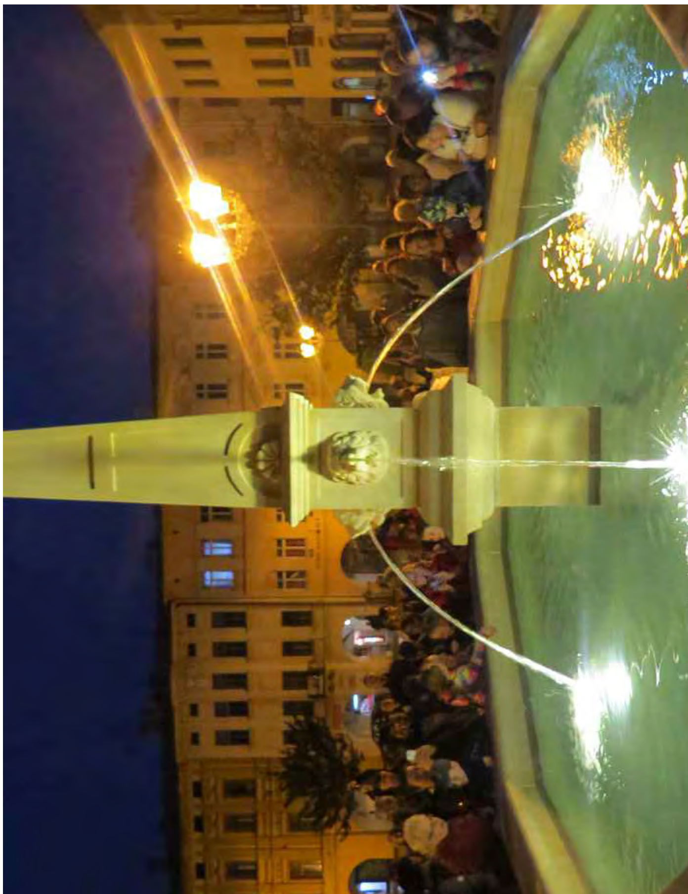
Obr. č. 29: Příklad izolace kašny vloženou plechovou vanou - kašna ve Frýdku-Místku.