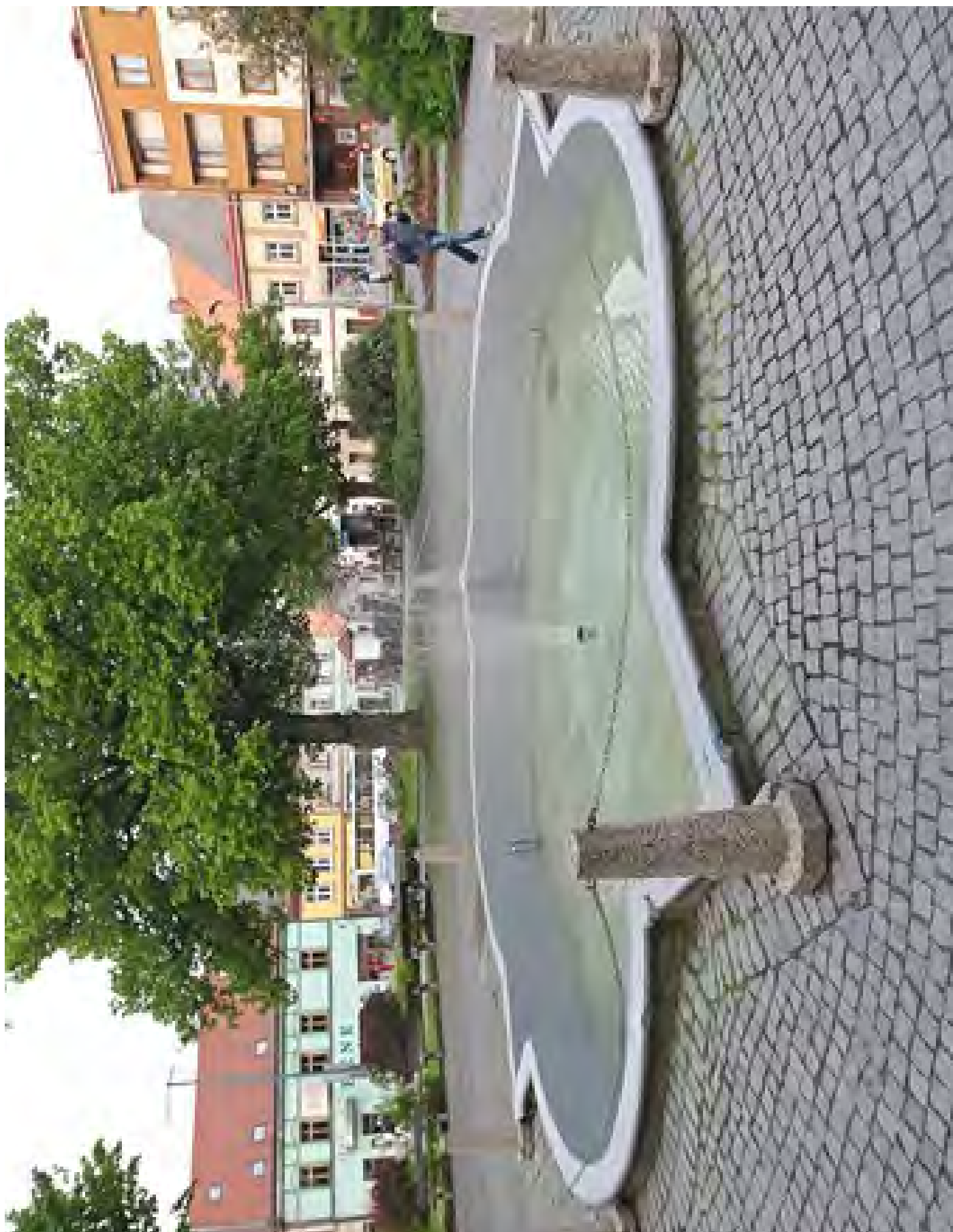
Obr. č. 20: Příklad tradiční izolace kašny stěrkou a nátěrem stěrky - kašna v Chotěboři.