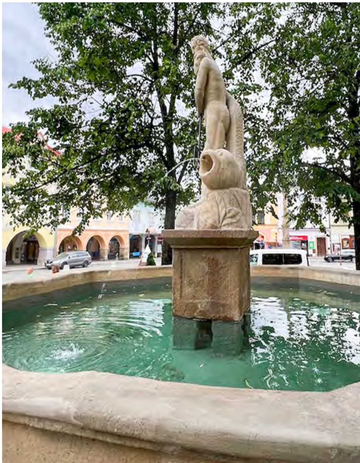
Obr. č. 21: Příklad tradiční izolace kašny stěrkou a nátěrem stěrky - kašna ve Frenštátu pod Radhoštěm.