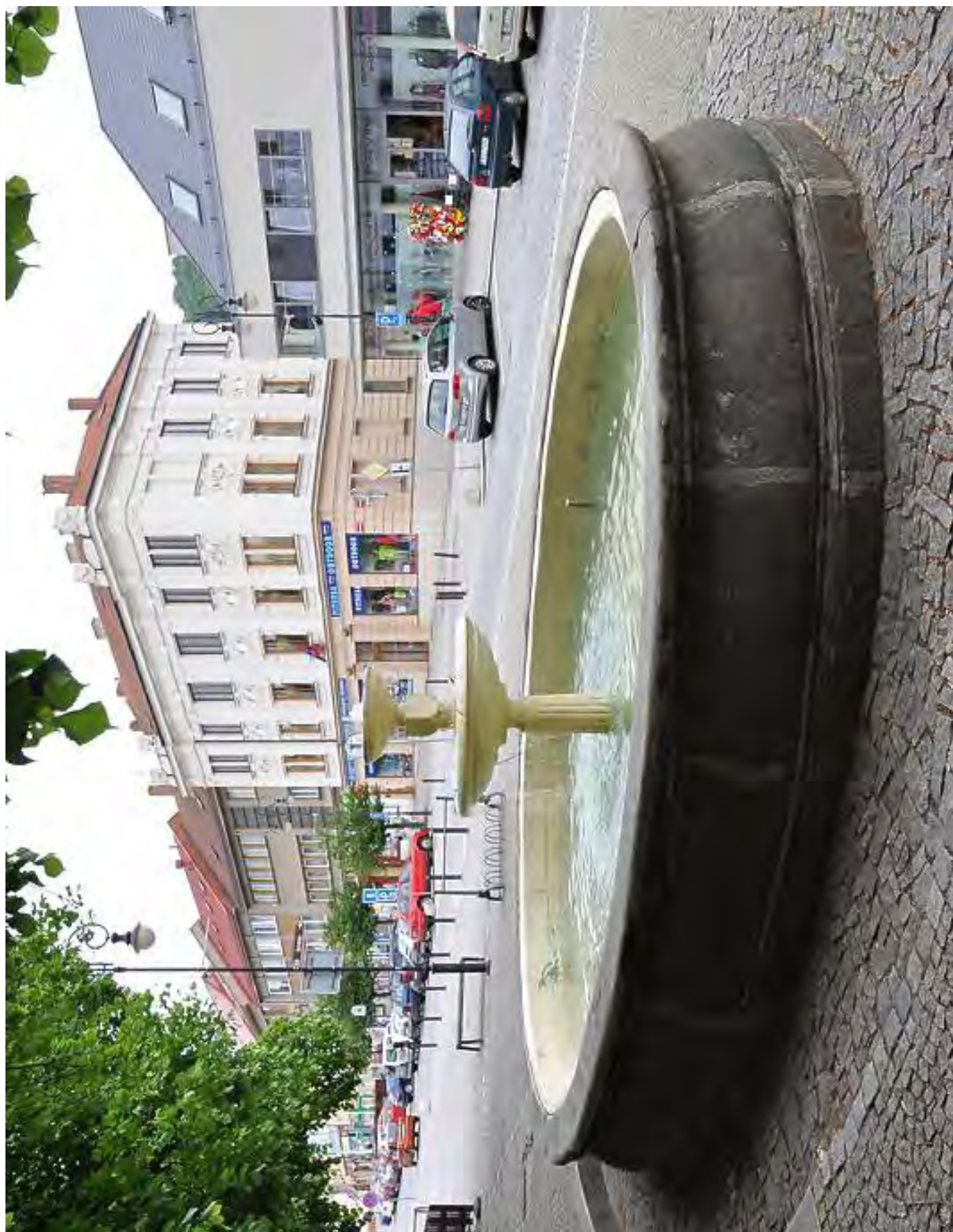
Obr. č. 19: Příklad tradiční izolace kašny stěrkou a nátěrem stěrky - kašna v Blansku.