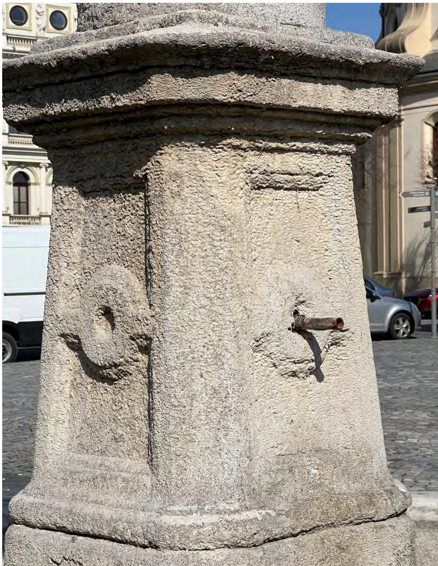
Obr. č. 11: Stav památky 3/2024 - středový pylon s vyústěním vodního chrliče.