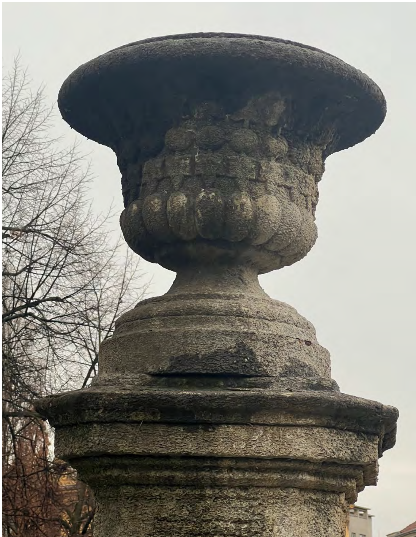
Obr. č. 6: Stav památky 1/2024 - středový pylon s vázou - detail vázy.