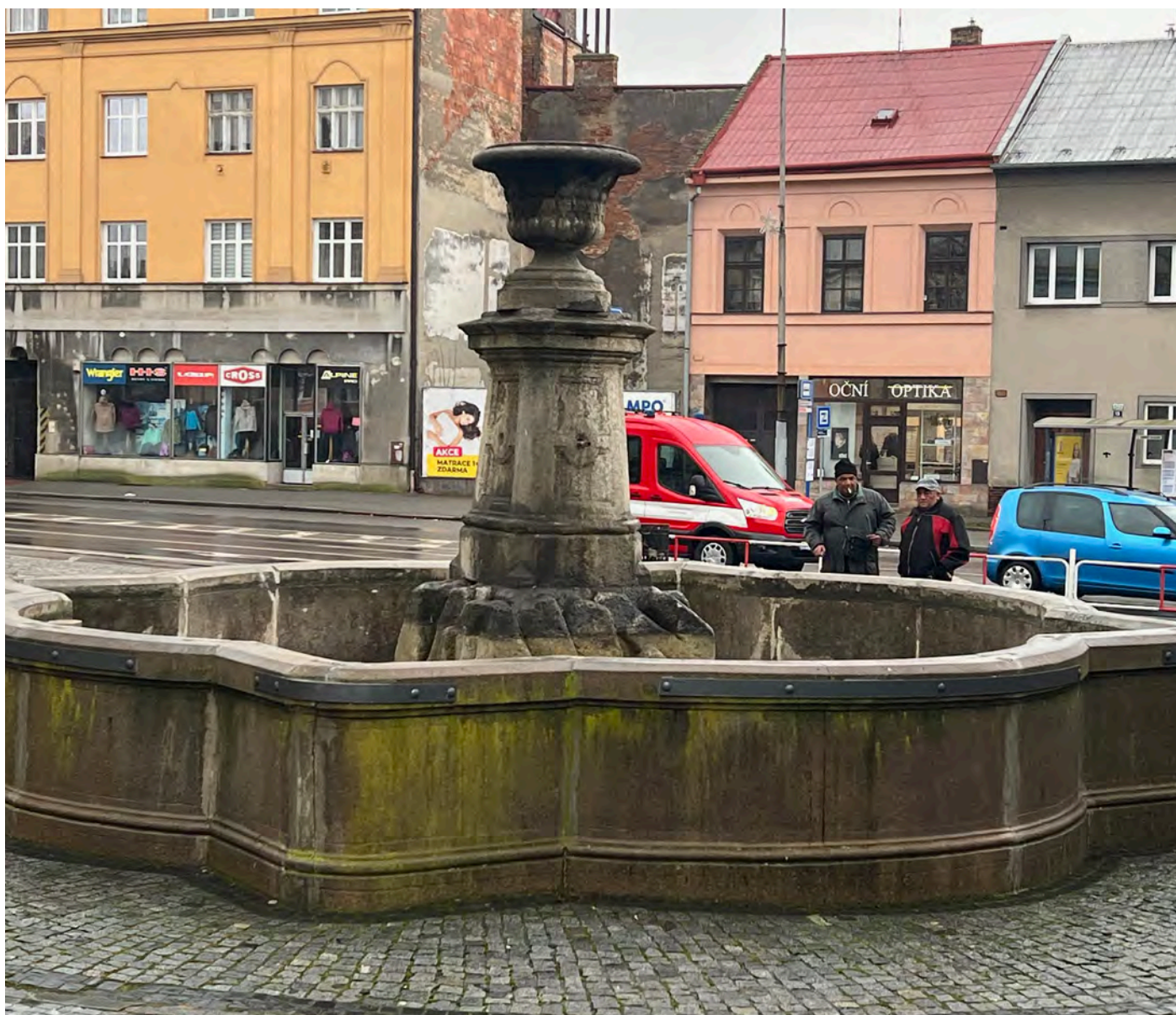
Obr. č. 3: Stav památky 1/2024 - celkový pohled.