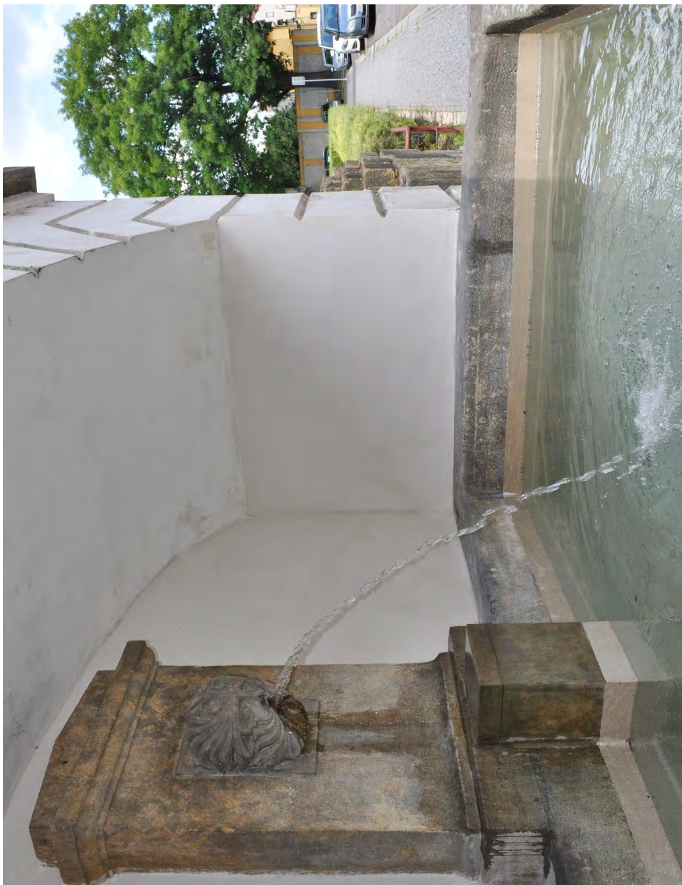
Obr. č. 25: Příklad tradiční izolace kašny stěrkou a nátěrem stěrky - kašna v Litoměřicích.