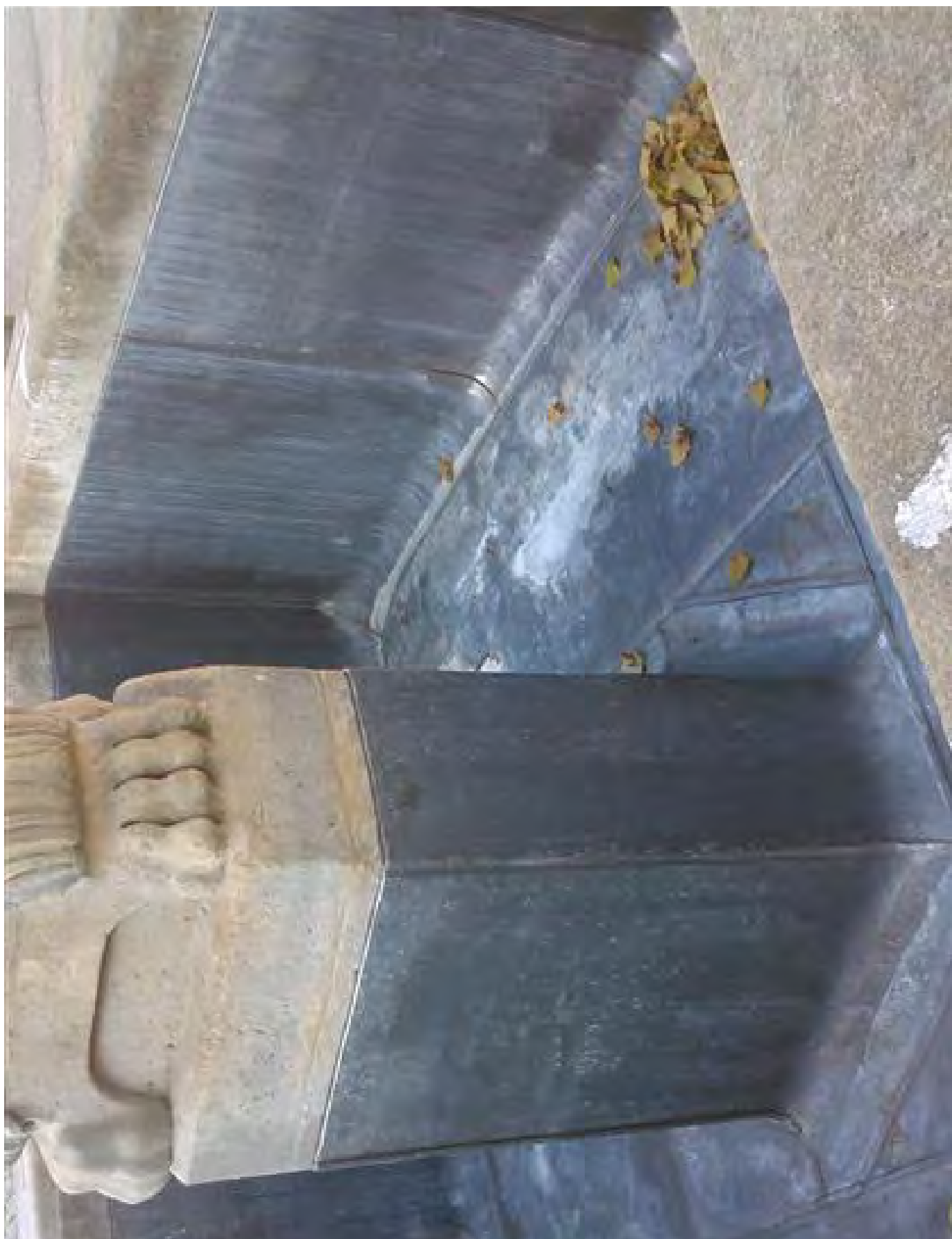
Obr. č. 28: Příklad izolace kašny vloženou plechovou vanou - kašna Lomnici.