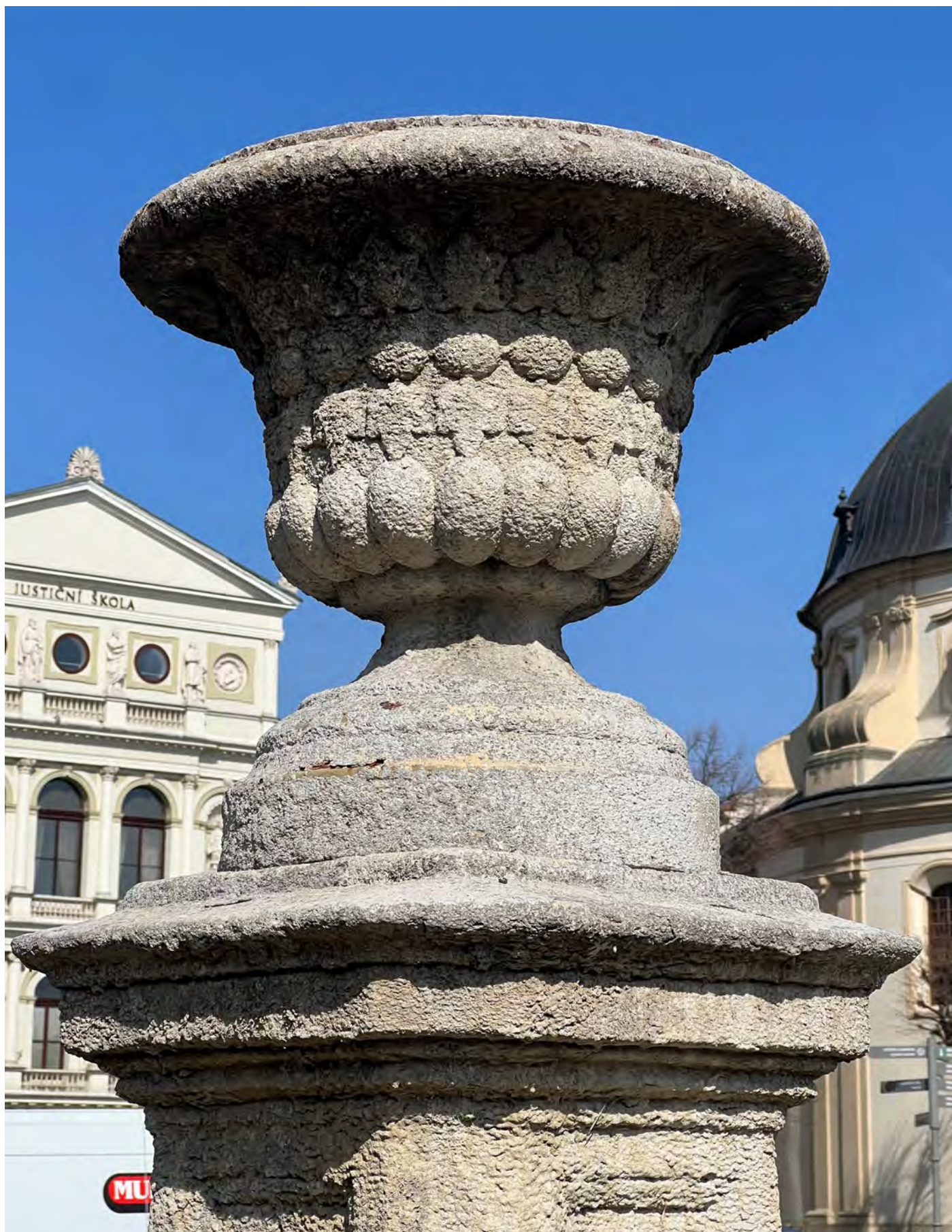
Obr. č. 7: Stav památky 1/2024 - středový pylon s vázou - detail vázy.