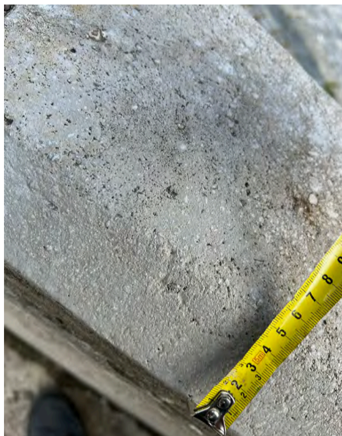
Obr. č. 17-20: Stav památky 3/2024 - rozměrové snímky.