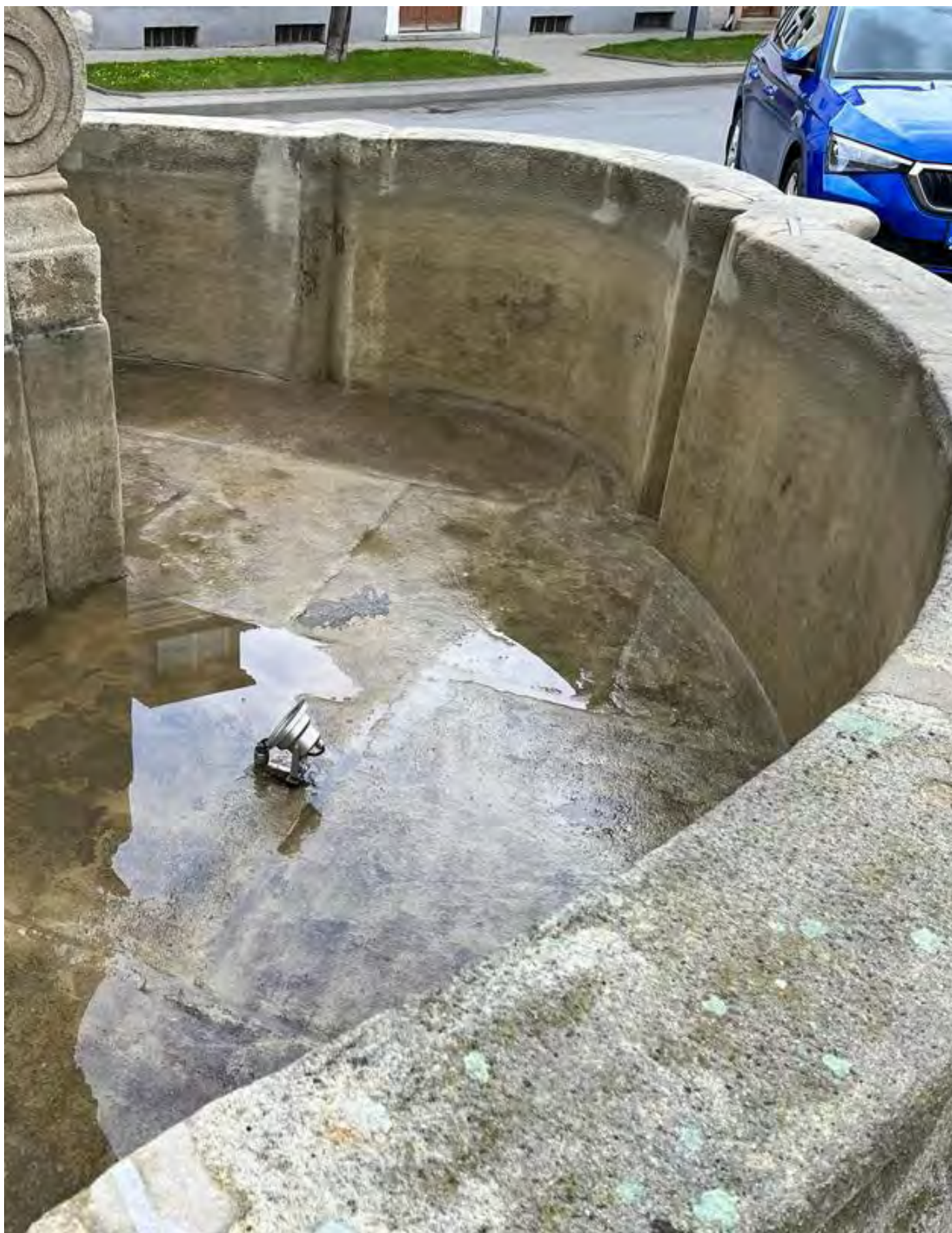
Obr. č. 23: Příklad tradiční izolace kašny stěrkou a nátěrem stěrky - kašna ve Fulneku po 1 sezoně provozu.