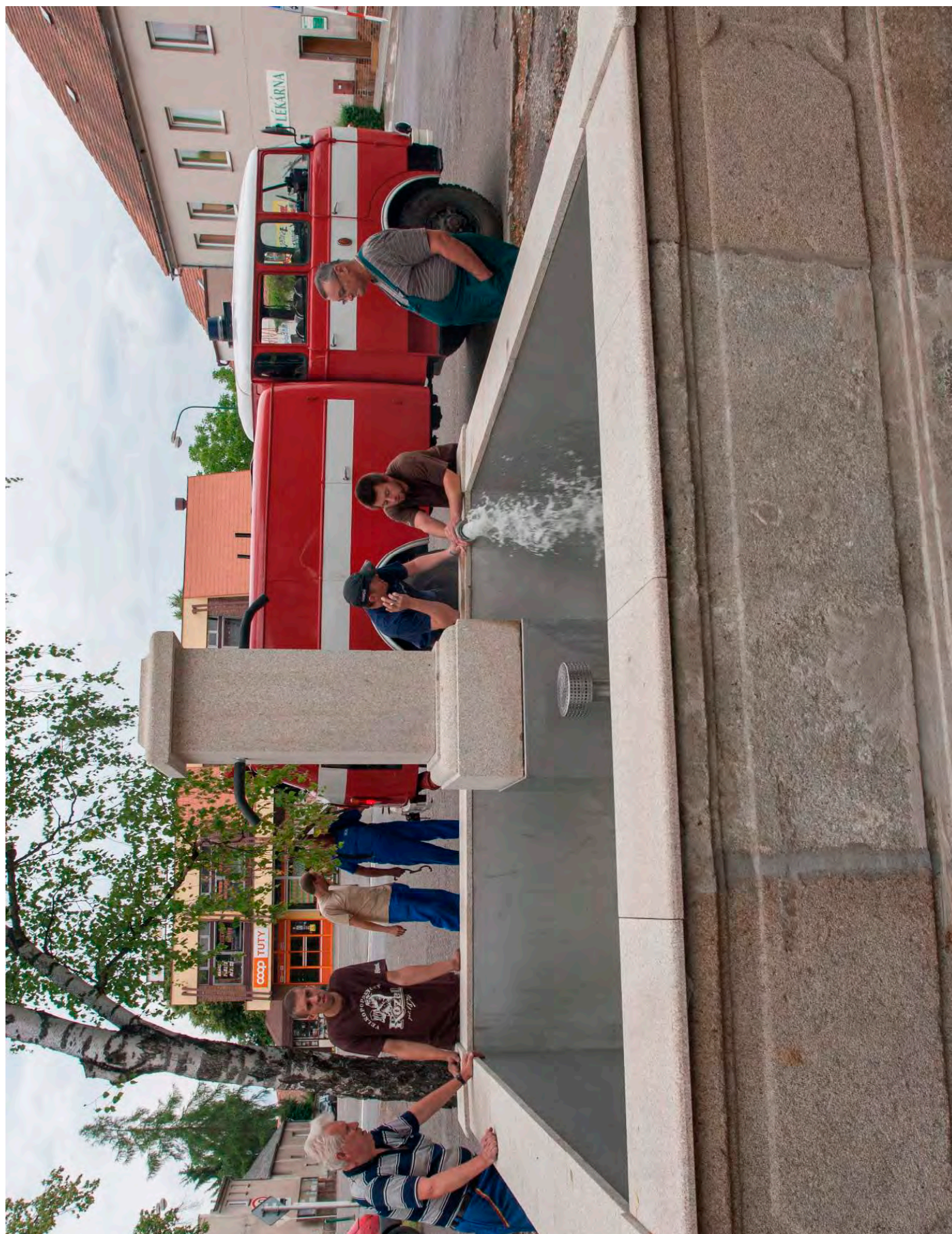
Obr. č. 27: Příklad izolace kašny vloženou plechovou vanou - kašna v Ronově.