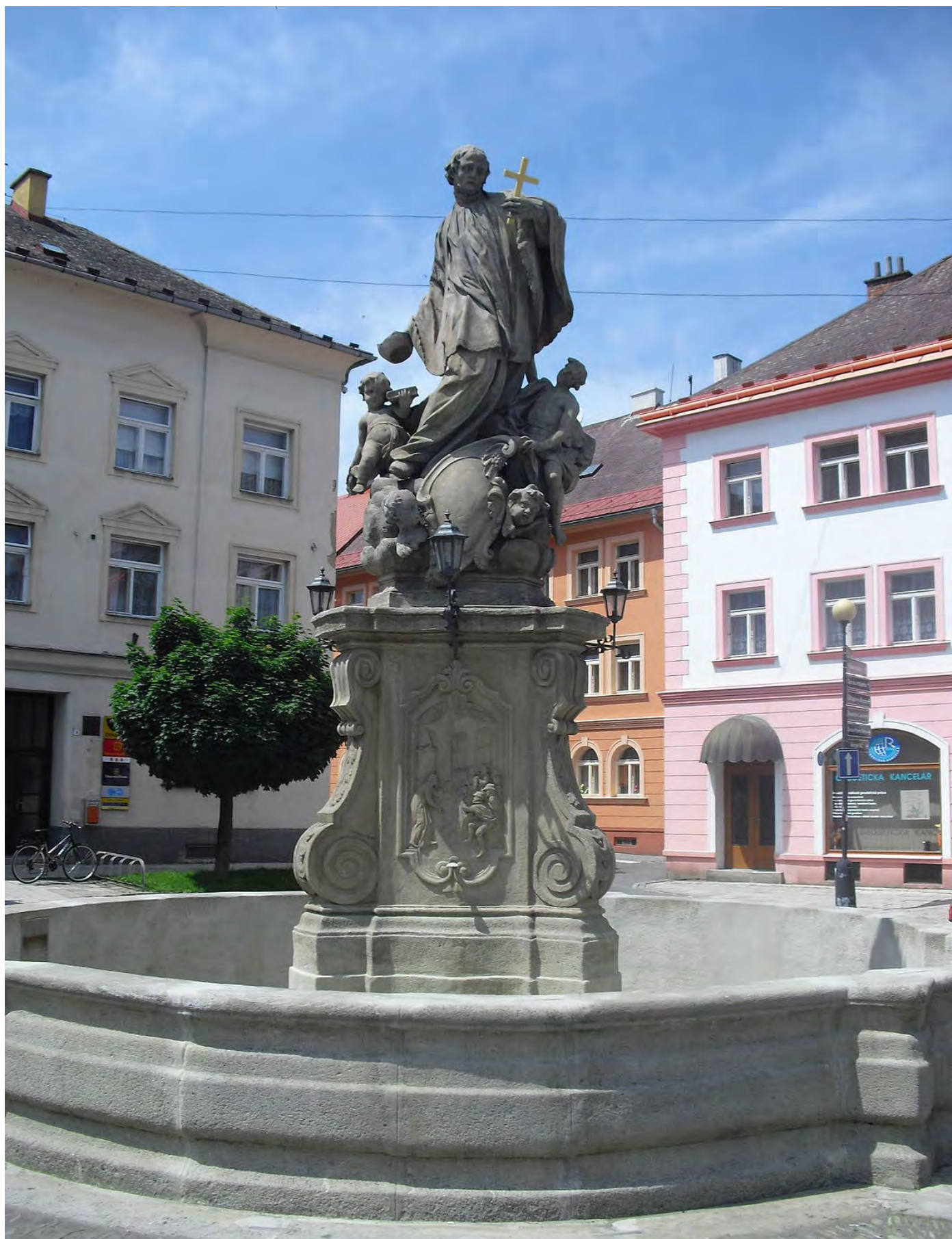
Obr. č. 22: Příklad tradiční izolace kašny stěrkou a nátěrem stěrky - kašna ve Fulneku.