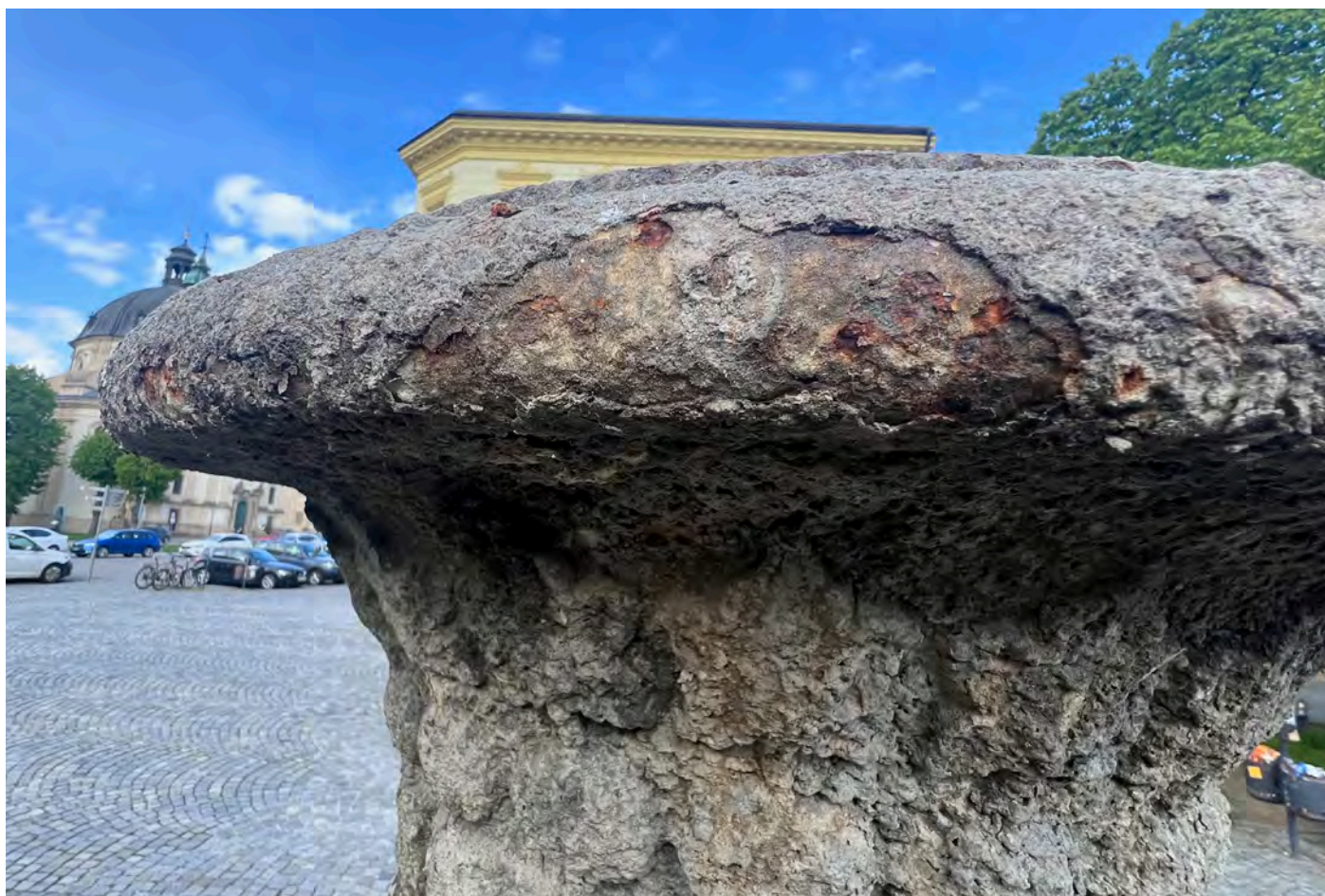
Obr. č. 8-9: Stav památky 3/2024 - středový pylon s vázou - detaily vázy.