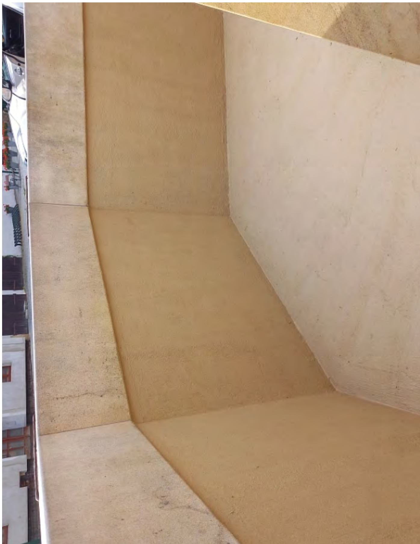
Obr. č. 24: Příklad tradiční izolace kašny stěrkou a nátěrem stěrky - kašna v Hradci nad Moravicí.