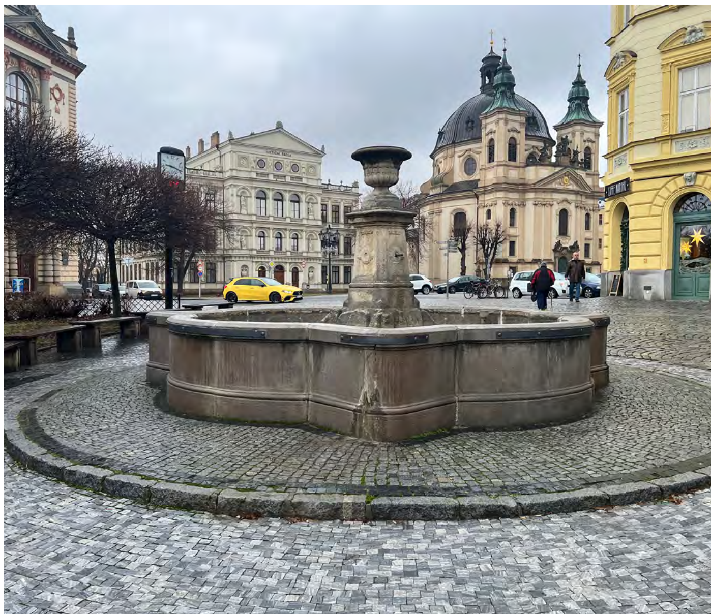
Obr. č. 2: Stav památky 1/2024 - celkový pohled.