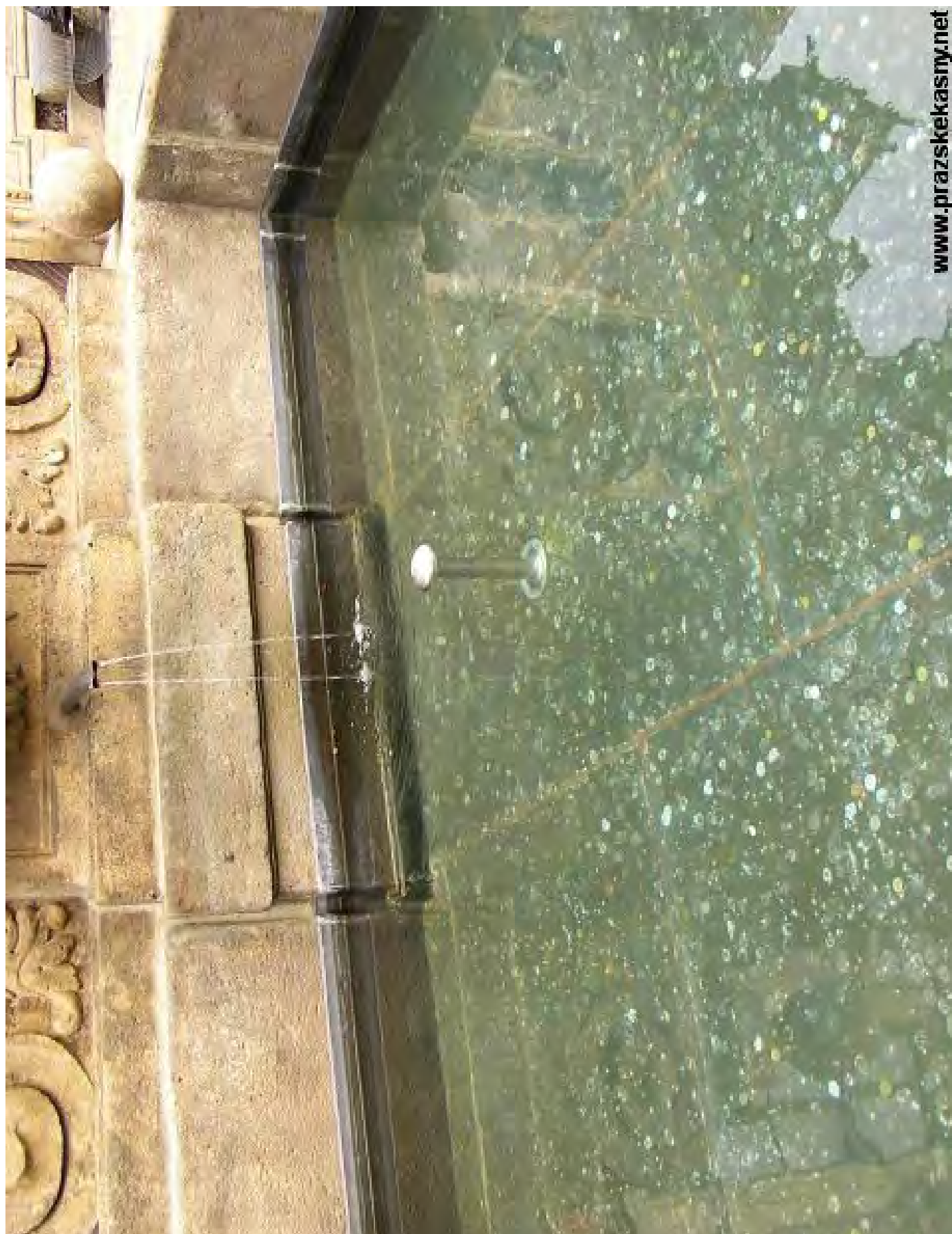
Obr. č. 26: Příklad izolace kašny vloženou plechovou vanou - kašna v Praze - Karlovo nám.