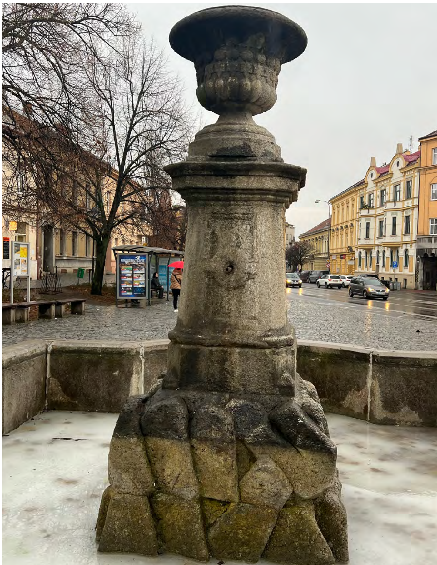
Obr. č. 4: Stav památky 1/2024 - středový pylon s vázou.